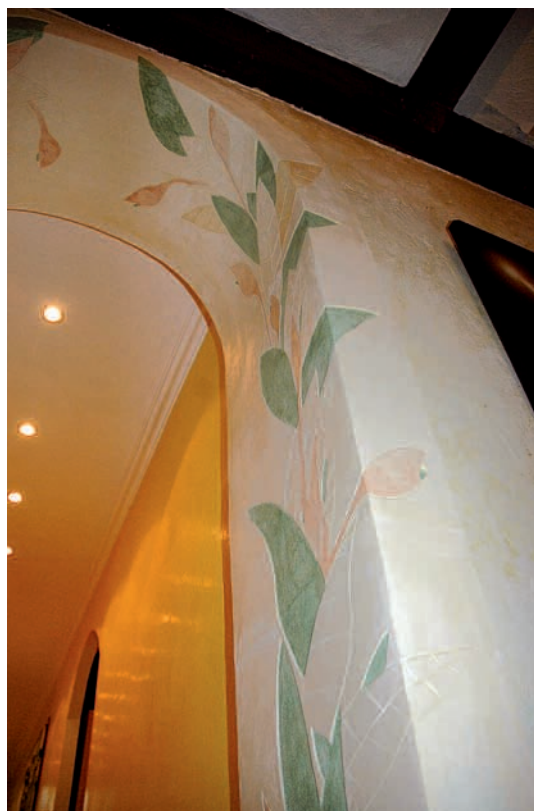
Décor réalisé en stuc à la chaux ou sgraffito, revêtement décoratif qui associe de la poudre de marbre et des pigments naturels.

jours à un mois suivant les matériaux choisis et la finesse des "tesselles" (morceaux de matière constituant la mosaïque). Pour les projets de taille importante, cela devient donc un travail d'équipe, sur lequel vont intervenir plusieurs mosaïstes, surtout si les délais de livraison sont précis (pour les chantiers de construction la plupart du temps ou pour des chantiers de restauration du patrimoine). Le prix au mètre carré est lui aussi très variable, en fonction des