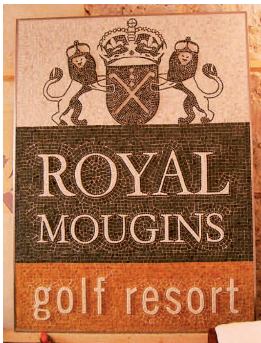
Enseigne de 150 x 200 cm : mélange de marbres bruts, de relief de 2 cm et de surfaces planes, de marbres polis ou mats. Le marbre a été hydrofugé.