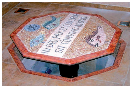
Création inspirée d'une mosaïque antique, réalisée pour le baptistère de l'Eglise Saint-Jean Bosco à Cannes. Elle représente, dans un octogone de 80 cm, bombé en son centre, des poissons, des symboles et une inscription latine.