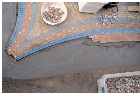
Restauration des mosaïques de la Villa Empain à Bruxelles. Les mosaïques sont situées sous une pergola autour d'une piscine. 45 m 2 de mosaïques ont été refaits en atelier puis installés sur le chantier. Environ 80 m 2 ont été restaurés sur place.